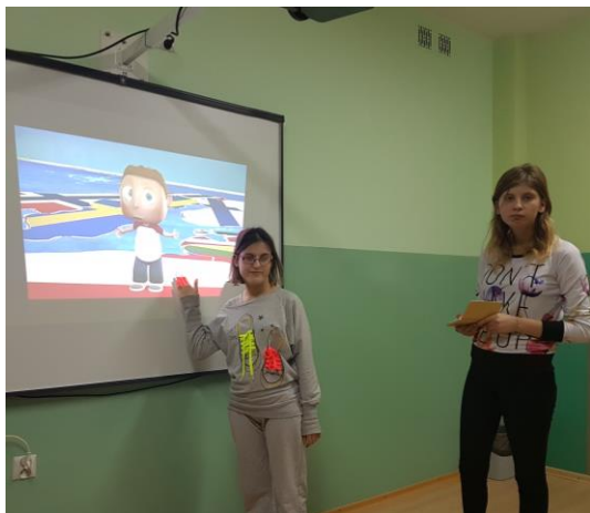
Uczennice chętnie ostawiają się do fotografii