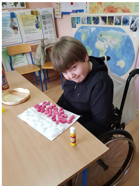
A tu Ola prezentuje swoją pracę